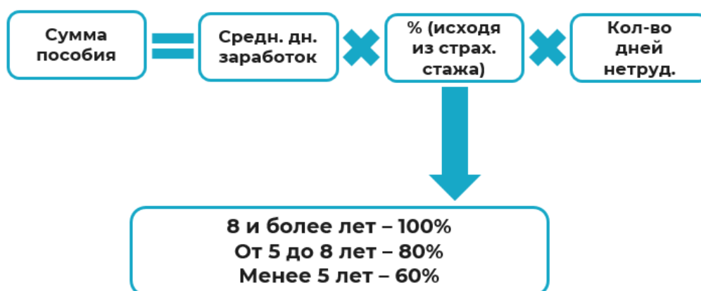
Рисунок 2. Алгоритм расчета пособия по временной нетрудоспособности.

Сумма пособия по временной нетрудоспособности определяется по формуле, указанной на рисунке 2.