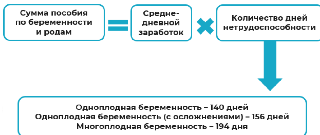
Рисунок 3. Алгоритм расчета пособия по беременности и родам.

дней — одноплодная беременность с осложнениями, 194 дня — многоплодная беременность).